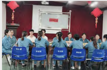
9月27日,质量部成品检验班组举行了迎“双节”家国同庆主题活动,开展了看图猜成语、你比我猜、脑筋急转弯等活动,组员间配合默契,现场气氛活跃。(葛宰华)