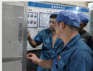
随着自动测振仪的推广和运用,9月,制造二车间机修班组织全体作业人员进行了自动测振仪的使用培训。(杨玉珍)