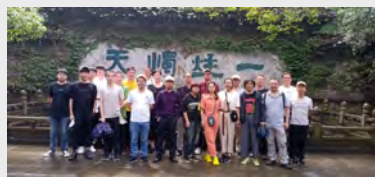
9月19日~20日,技术部门工会小组组织全体人员绍兴二日游。(羊君)