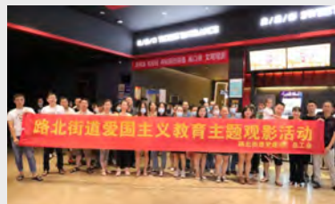
9月7日,公司工会组织员工百余人参加了由路北街道党总办、总工会举办的“路北街道爱国主义教育主题观影活动”。(王振)