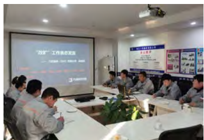
1月20日,长兴设备部进行了全员“改、扩”工作表态发言。(刘卫东)