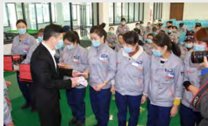
1月28日,路桥区总工会、区文联、峰江街道两新工委、总工会来八环开展“寒冬送春联 墨香暖人心”——我在路桥过大年暖心活动,为职工现场书写春联和福字300多幅。(王振)