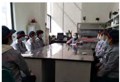
1月30日,质量部成品检验班组进行了“改、扩”表态发言。(葛幸华)