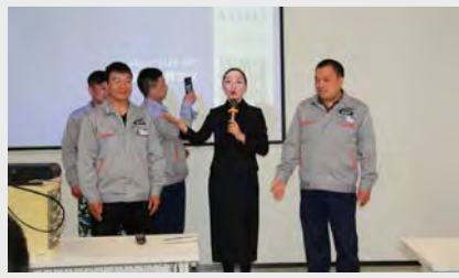
2月2日~3日,通用产品车间针对混料问题组织骨干人员分析原因,制订了相应的管理规定,同时对相关人员进行了学习培训。(杨玉珍)