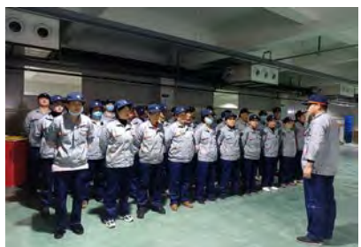
1月24日,通用产品车间组织全员开展了“改、扩”表态发言。(杨玉珍)

“诚信、奋斗、创新、高效”,是八环企业文化的核心理念,只要我们继续发扬吃苦耐劳的八环传统,以加倍的努力去付出,“百年品牌 百亿八环”的目标就一定能实现。