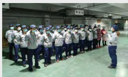
1月19日,集团外籍专家德田先生带领质量团队对各车间的品质管理现状进行了全面检查,并结合国内外优秀案例,对发现的问题进行了指正。(朱俊浩)